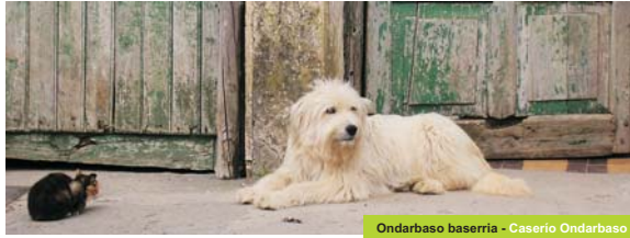
Ondarbaso baserria - Caserio Ondarbaso

observaremos poco después de una zona de caseríos la roca de Aizbakar sobre nuestras cabezas, y a partir de aquí comenzaremos a vislumbrar el mar. En el recorrido podremos disfrutar de la vista del valle del Urola y observar la ubicación de sus pueblos, así como del lado norte del macizo de Izarraiz. Siguiendo el camino pronto llegaremos al cruce de Ondarbaso, desde donde descendemos hasta el valle de Goltzibar, con extensos bosques de ribera que cierran el valle. Continuando por el curso del riachuelo llegaremos a la altura de la granja-escuela Sasarraín, la cueva de Ekain, el palacio Lili y finalmente Zesto. Si optamos por hacer el recorrido en dirección Zesto-Azpeitia el lugar de inicio es la fuente de Laiturri junto al Puente Viejo de Zesto. Desde ese punto tomaremos el camino que discurre frente al palacio Lili. Hay que destacar el hecho de que nos encontramos ante una zona rica en cuevas, muchas de las cuales fueron habitadas en época prehistórica.