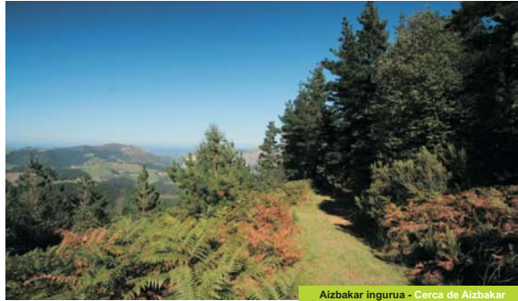
Aizbakar ingurua - Cerca de Aizbakar

Nabarmendu beharra dago haizulotan aberatsa den ingurunea dela hau eta, horietako askotan, jendea bizi izan zela historiaurrean. Guztietan nabarmengarriena, adierazgarririk onena Ekaingoa da, 70 irudiz gora osatutako arte multzoa baitu: irudi gehienak margotuta daude, eta beste batzuk, grabatuta. Gehien irudikatutako elementua zaldia da, baina bisontek, oreinak, ahuntzak, hartzak eta izokin bat ere ageri dira. Pinturak Madeleine aldikoak dira, eta 12.000tik 14.000 urtera bitartean dituzte. Erreplika bide aldamenen kokatuta dago eta laster zabalduko dute.