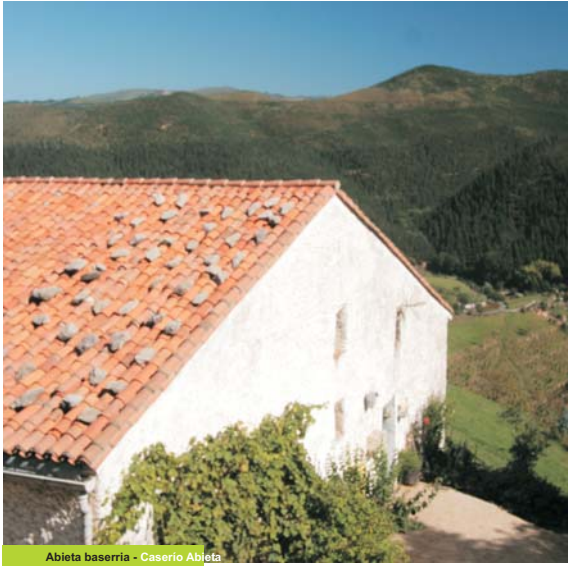
Abieta baserria - Caserio Abieta

Zestoara hurbildu ahala, bidearen erdialdean, Aizbakar arroka dago baserri batzuen ondoan eta, hortik aurrera, itsasoa ikus daitezke; Urola bailara eta bertako herrien kokalekua ere ikus daitezke, baita Izarraizko mendigunearen iparraldea ere.