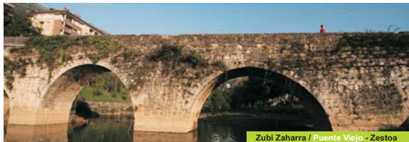
Zubi Zaharra / Puente Viejo - Zesto

observaremos poco después de una zona de caseríos la roca de Aizbakar sobre nuestras cabezas, y a partir de aquí comenzaremos a vislumbrar el mar. En el recorrido podremos disfrutar de la vista del valle del Urola y observar la ubicación de sus pueblos, así como del lado norte del macizo de Izarraiz. Siguiendo el camino pronto llegaremos al cruce de Ondarbaso, desde donde descendemos hasta el valle de Goltzibar, con extensos bosques de ribera que cierran el valle. Continuando por el curso del riachuelo llegaremos a la altura de la granja-escuela Sasarraín, la cueva de Ekain, el palacio Lili y finalmente Zesto. Si optamos por hacer el recorrido en dirección Zesto-Azpeitia el lugar de inicio es la fuente de Laiturri junto al Puente Viejo de Zesto. Desde ese punto tomaremos el camino que discurre frente al palacio Lili. Hay que destacar el hecho de que nos encontramos ante una zona rica en cuevas, muchas de las cuales fueron habitadas en época prehistórica.